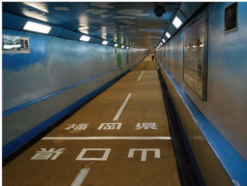
関門トンネル人道通路