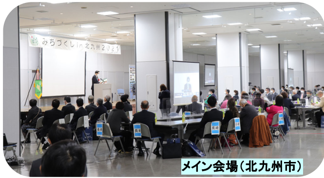
メイン会場(北九州市)

コロナ禍の中の開催ということで、全参加者が一堂に会するという形ではなく、北九州市のメイン会場のほか、各県のサテライト会場での参加、YouTubeでの視聴などを含めて、多くの道守さんが参加し、メインテーマである「みんなで手をつなごう一連携の道守活動へ」道守さんと他団体や行政との連携について活発な意見交換が行われました。