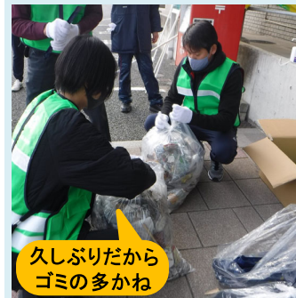
久しぶりだから ゴミの多かね