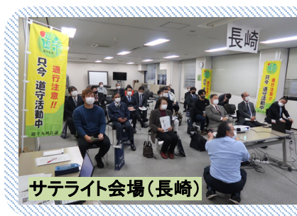
サテライト会場(長崎)