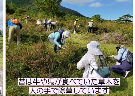
昔は牛や馬が食べていた草木を人の手で除草しています