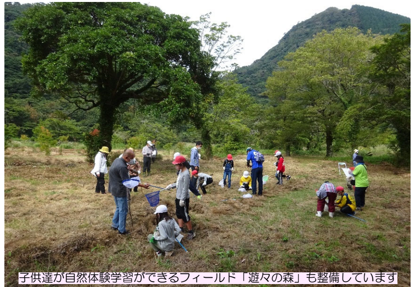
子供達が自然体験学習ができるフィールド「遊々の森」も整備しています