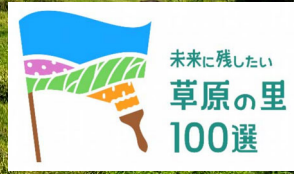
田代原の放牧草原は未来に残したい草原100選に長崎県で唯一選ばれています！