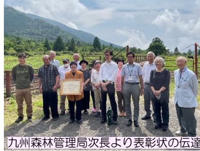
九州森林管理局次長より表彰状の伝達