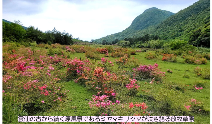
雲仙の古から続く原風景であるミヤマキリシマが咲き誇る放牧草原