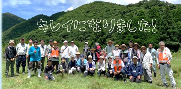
除去した大量の草木