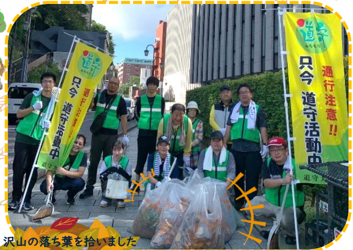
沢山の落ち葉を拾いました