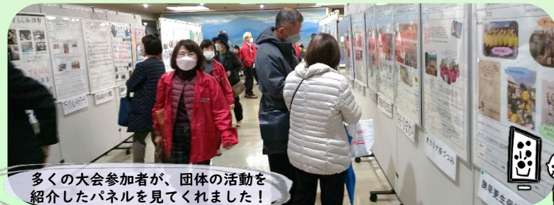
多くの大会参加者が、団体の活動を紹介したパネルを見てくれました!

①1月18日(木)に諫早文化会館で開催された、第18回諫早市社会福祉大会でのパネル展示 600名以上の参加者