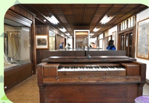
ド・ロ神父記念館